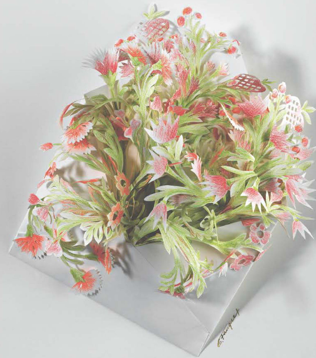
Liebesbrief ohne Worte, 2012 Estrellita Fauquex

Anmeldung bitte direkt an Erwachsenenbildung FFS 041 811 67 81 www.ffi-schwyz.ch/eb