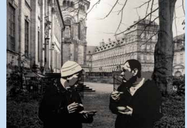
Gaasch/Müller: Sex (Bamberg) 2013

Wolfgang Müller (geb. 1961) ist seit 1990 als freischaffender Künstler in Bamberg tätig. Seine Werke waren u. a. im Neuen Palais ausgestellt. Zwischen 1996 und 2000 war er Erster Vorsitzender des Kunstvereins Bamberg. In der Galerie am Stephansberg hatte sich Müller ein Refugium aus Kunst und Genuss geschaffen. Mit dem Scherenschnitt nimmt sich der Künstler einer seltenen Technik der Kunst an. Zwischen minimalistisch-sparsamen Linienschnitten und mehrschichtigen, dreidimensionalen Figurenkompositionen erstreckt sich ein ganzer Kosmos künstlerischer Entfaltungsfreiheit. Die im Zusammenspiel entstehenden Figuren sind auf den ersten Blick leicht zu erkennen. Bei genauerem Hinsehen werden aber auch die ihr zugrundeliegenden abstrakten Schnittmuster sichtbar.