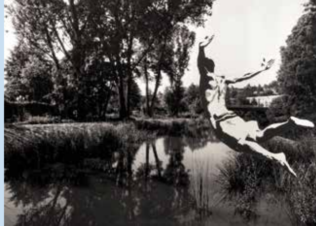
Gaasch/Müller: Übermut (Bamberg) 2013

Mit einer einfachen Nähscere schneidet Wolfgang Müller aus einfarbigen Papierbögen detailgenau die Graustufen der Figuren in abstrakten Formen aus. Erst durch Übereinanderlegen der Schnitte entstehen die dreidimensionalen Figuren, die passgenau unter die ausgeschnittenen Konturlinien auf den Fotografien eingefügt werden. Die Abzüge der zum Teil handvergrößerten Fotografien wurden auf speziellem Papier erstellt, um den Scherenschnitten Halt zu bieten.