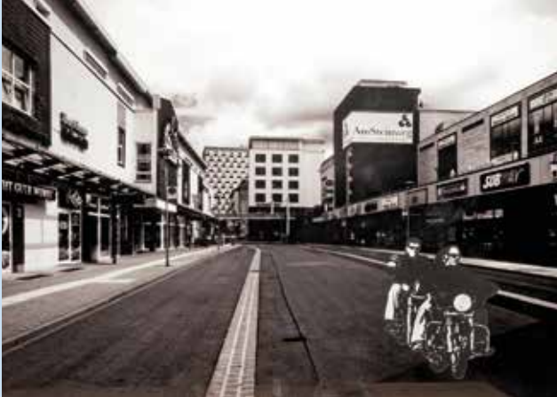
Gaasch/Müller: Leergefegt (Suhl) 2013